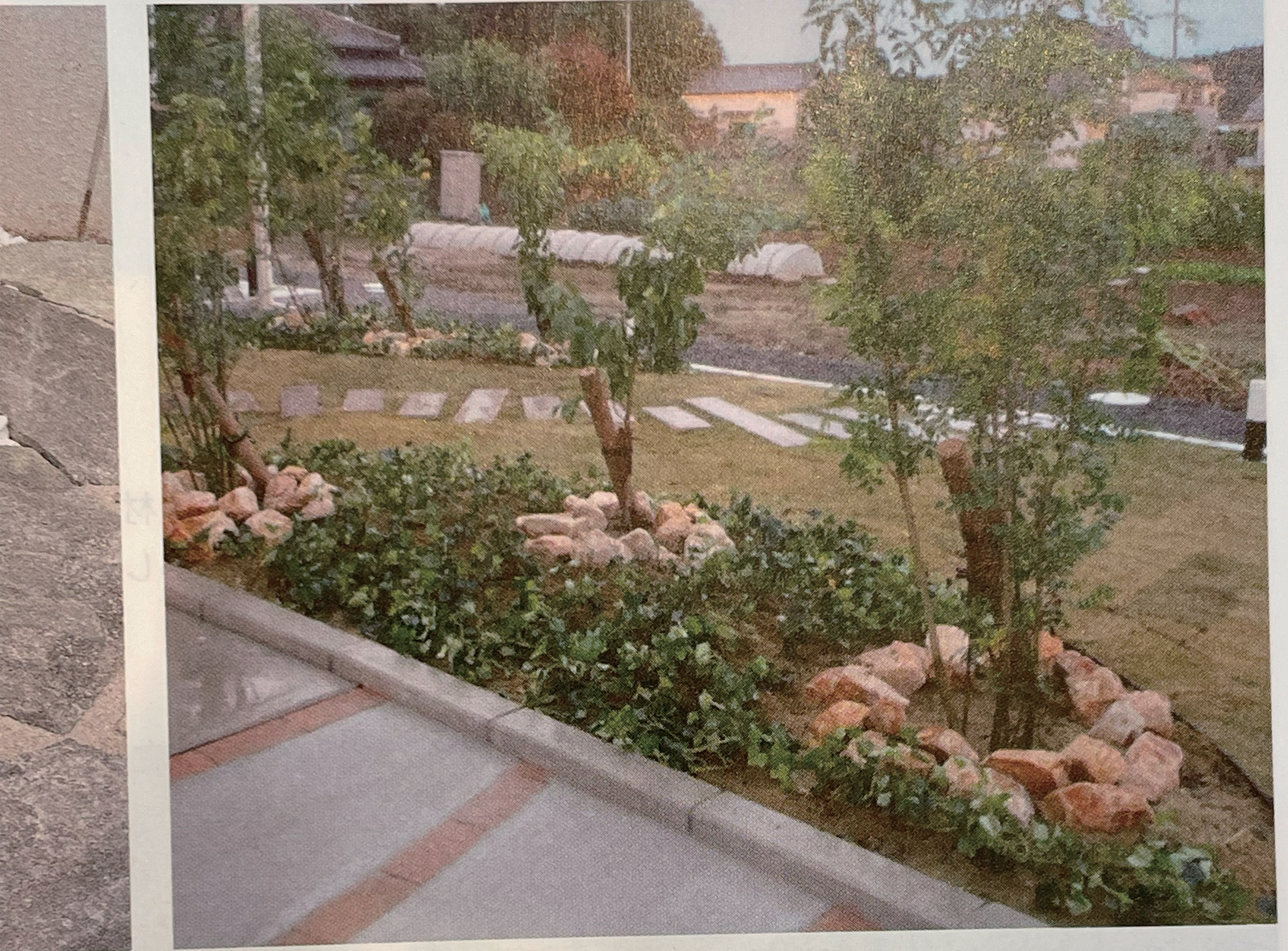
クリフイエロー(湿潤)